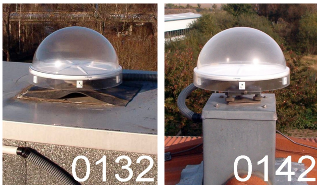
Abb. 2: Fotos der Referenzstationen mit Koordinaten-änderungen in der Höhe, die am weitesten von der mittleren Koordinatenänderung abweichen

Eine mögliche Ursache für die mittlere Abweichung von -13,9 mm kann in der Antennenkalibrierung im Feldverfahren mit Drehung liegen, bei der die Mehrwege-